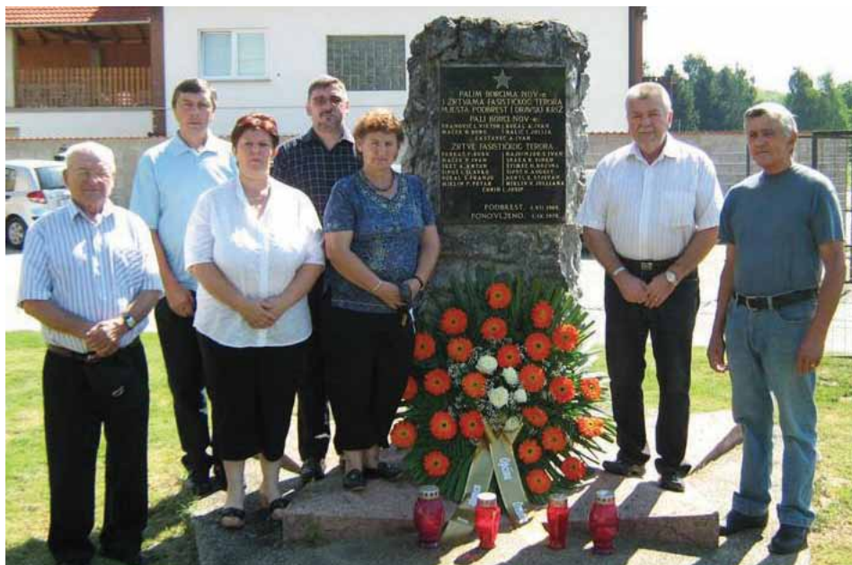
Polaganje vijenca u Podbrestu