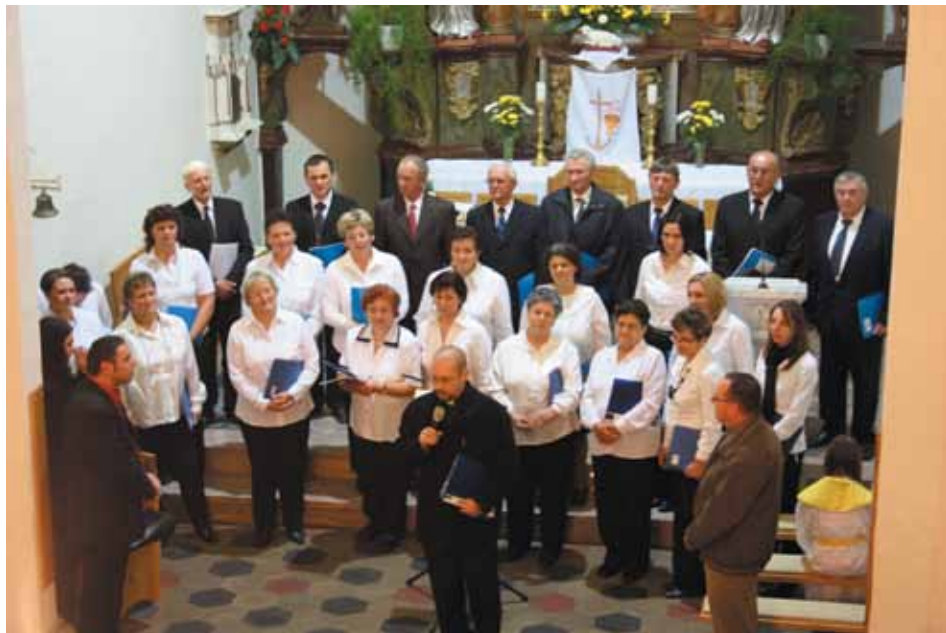
Nastup u župi Sv. Martin na Muri

pati sposobnosti dobivene od Boga. Župni mješoviti zbor je do sada nastupao u župi Sv. Martina na Muri, u župi Pribislavec, župi Ivanovec prigodom proslave Sv. Cecilije te susreta zborova iz našeg Čakovečkog dekanata, i u Koprivničkom Ivancu za proštenje sv. Ivana Krstitelja. Pjevajmo Bogu na slavu i nama na spasenje.