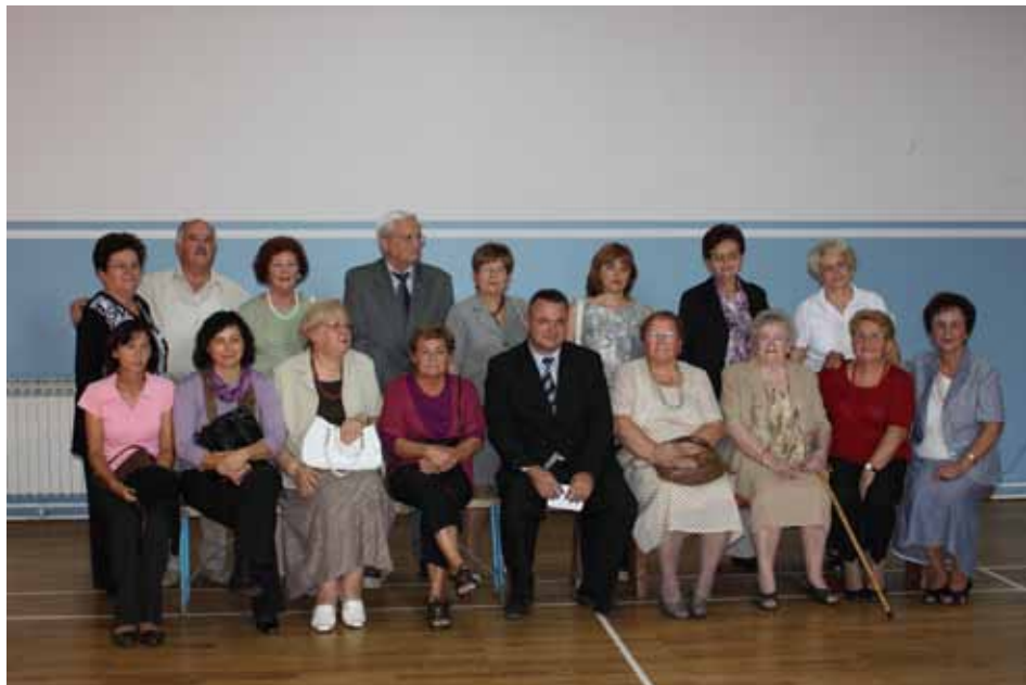
Bivši djelatnici OŠ Orehovica

5. listopada 2011. obilježava se Svjetski dan nastavnika. Djelatnici Osnovne škole Orehovica ove su godine odlučili na poseban način obilježiti svoj dan. Uoči preseljenja u novu školsku zgradu pozvali su svoje bivše djelatnike koji su dio