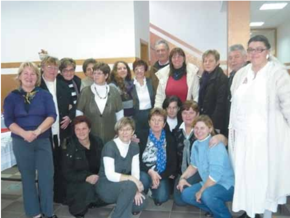
Aktiv žena Podbrest

prostora u polju te jedno ispumpavanje podruma u Podbrestu. Pravovremenim izlaskom i efikasnom intervencijom spašeno je puno materijalnih dobara, što operativnoj postrojbici može služiti na čast.