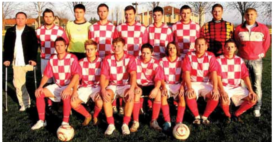
NK "Croatia" Orehovica

Pozivamo sve mještane općine Orehovica i ljude dobre volje da nam se pridruže na našoj tradicionalnoj Štefanjskoj priredbi koja će se održati 26. prosinca 2011. u dvorani društvenog doma općine Orehovica!