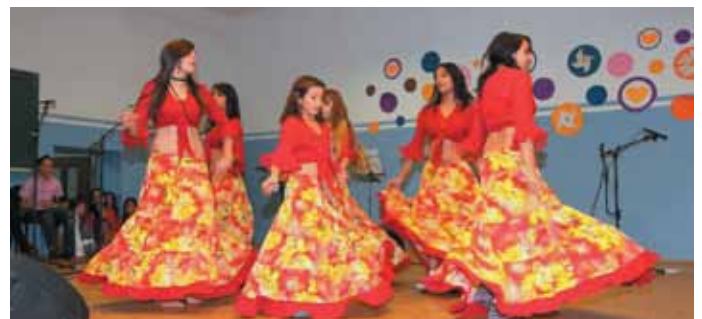
Plesna točka na festivalu

Nakon svečanosti potpisivanja Sporazuma za sve je uzvanike i posjetitelje Međunarodnog festivala romske glazbe i plesa bio organiziran domjenak i druženje.