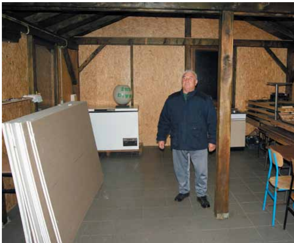
ŠRD "Diver" Podbrest - Sveti Križ