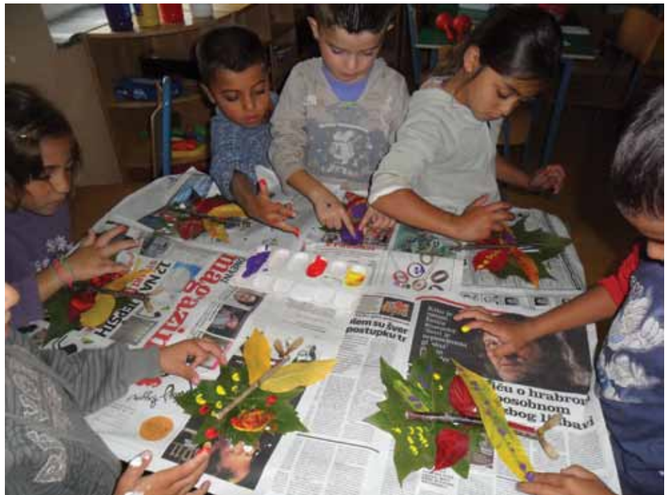
Polaznici predškole na jednoj od aktivnosti

Predškolska djeca također sudjeluju u svim školskim aktivnostima, događanjima, manifestacijama i priredbama.