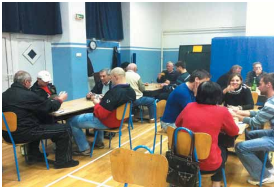
Turnir u belotu u organizaciji NK "Croatia" Orehovica

Na kraju želimo sem penzionerima i onima kaj to tek bodo, sem revoščanima, podbreščoncima i vulorčanima, sem ljudima dobre