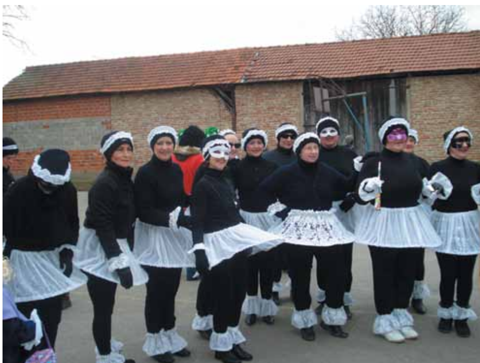
Članice udruge "Sport za sve" na fašničkoj povorci

Dobrovoljno vatrogasno društvo Orehovica ove je godine bilo aktivnije nego prošlih godina, pa smo tako u 5. mjesecu provjerili ispravnost svih hidranata i vatrogasnih ormarića na području našeg sela. Ove godine formirana je i A-ekipa DVD-a Orehovica te smo na Međuopćinskom natjecanju u Gardinovcu nastupili s 2 ekipe: 1 A-ekipom i 1 B-ekipom. Bili smo aktivni i u predžetvenoj te žetvenoj sezoni. Obavili smo razgovore o sigurnosti i prevenciji od požara s našim kombajnerima, a u samom jeku žetvene sezone vršili smo ophodnju po poljima. Puno truda utrošilo se i na unutarne uređenje novog vatrogasnog spremišta u