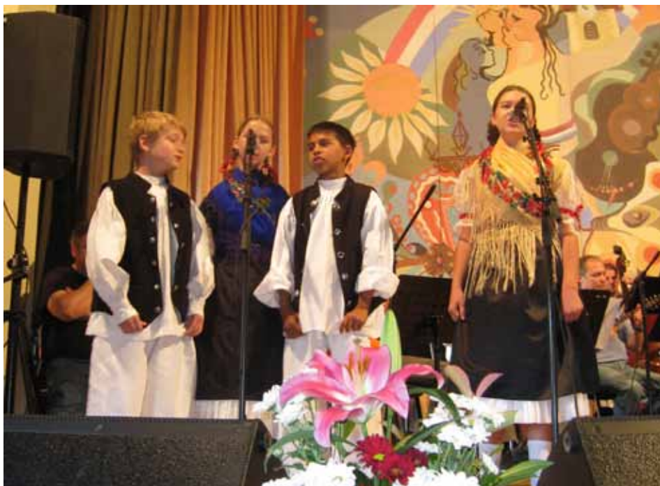
Učenici na nastupu na festivalu dječje kajkavske popjevke u Zlataru