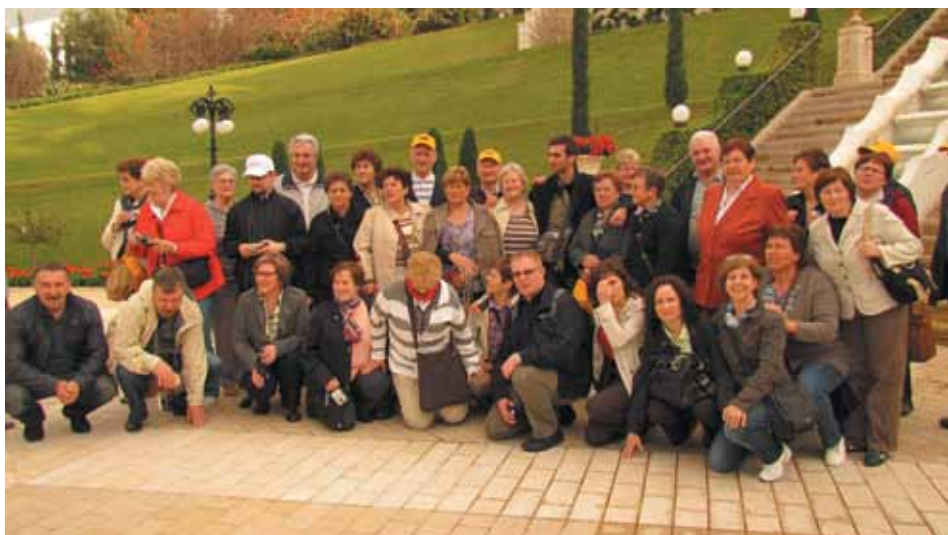
Hodočasnici u Svetoj zemlji