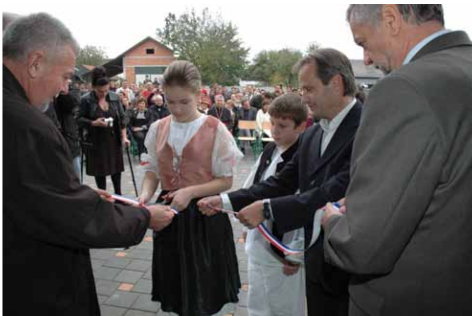
Otvorenje nove školske zgrade OŠ Orehovica

Na kraju dana učenici svakog razreda prezentirali su pomoću plakata ostalim učenicima što su naučili. Plakati su izloženi na školskim panoima tako da će svi učenici imati priliku pogledati plakate, još nešto naučiti i glasati za najbolji plakat.