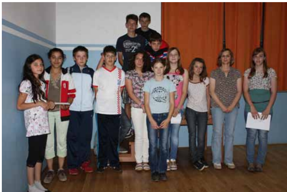
Mali autori literarnih radova objavljenih u zbirci "Zlatne vrpce"