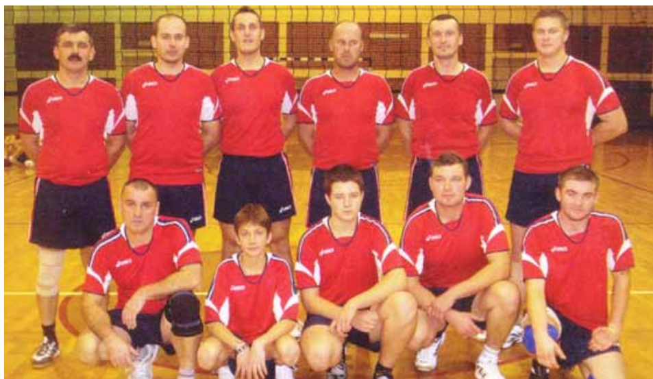
OK "Mladost" Vulatija

Klub je u kolovozu organizirao i Noćni odbojkaški turnir na kojem su uz našu ekipu sudjelovale ekipe iz Totovca, Črećana i Varaždinskih Toplica, a isto tako je već tradicionalno naš klub organizirao i Malonogometni turnir u Vulariji na kojem sudjeluju ekipe pojedinih ulica u mjestu Vularija, a ove godine je s obzirom na izgrađeni objekt u športskom parku u Vulariji organizirano i prigodno druženje uz glazbu, jelo i piće.