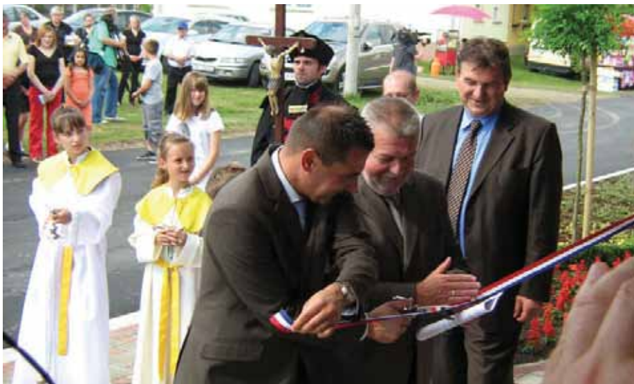
Rezanje vrpce na otvorenju društvenog doma u Podbrestu