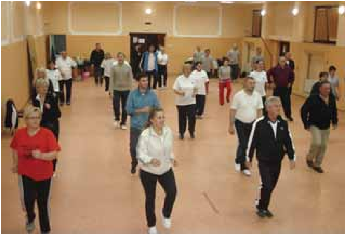
Sportsko-rekreativni susret ekipa općina i gradova

24. studenog 2011. provedena je druga akcija dobrovoljnog darivanja krvi kojoj je pristupilo ukupno 31 darivatelj od čega je krv darovalo 22 darivatelja, a 9-ero je odbijeno. Zahvaljujemo se darivateljima!