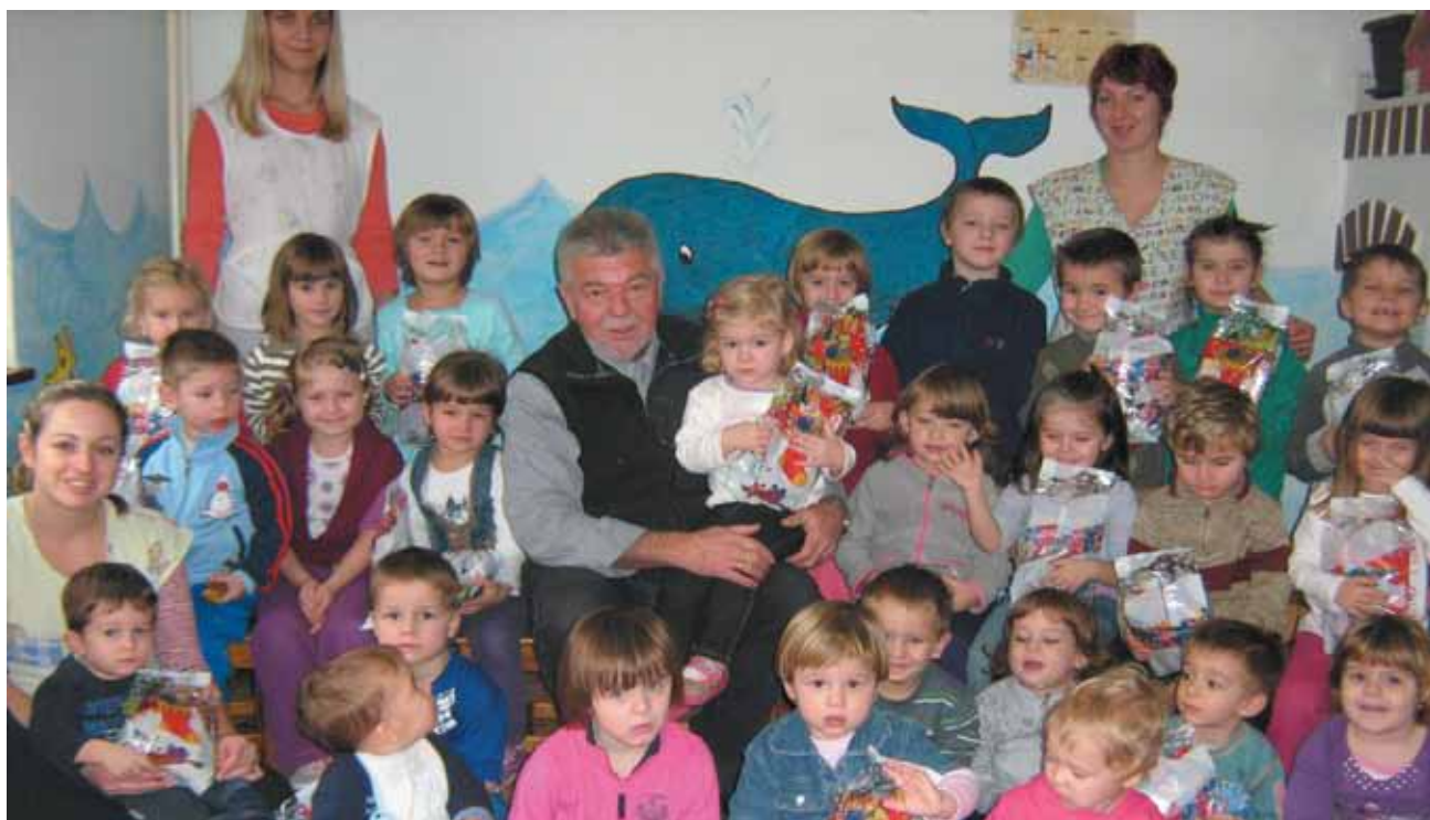
Posjet načelnika općine Orehovica dječjem vrtiću Medo povodom blagdana sv. Nikole

Zahvaljujemo Općini Orehovica na kontinuiranoj suradnji, kao i na prigodnim poklonima povodom blagdana Svetog Nikole.